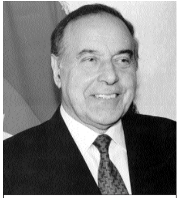
“Ağstafanın füsunkar təbiəti, gözəl insanları vardır”. Heydər Əliyev